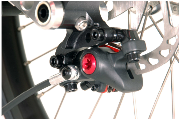
Tektro Volans mit rot eloxierten Applikationen

Die Scheibenbremse Tektro Auriga gekoppelt mit Einhebelbedienung ist optional für ICE Adventure, ICE Adventure HD sowie ICE Sprint erhältlich. Die einzeln gebremste hydraulische Tektro Scheibenbremse heißt jetzt Tektro Volans. Bei gleichbleibendem Preis ist sie optisch noch schöner und filigraner geworden (empf. VK 249,00).