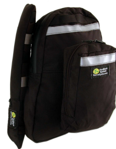
FastBack Pump Pack und Tool Pouch kombiniert mit Carbon Slim Top Tasche zur Befestigung am Netzsitz

und Clips an den FastBack Trinksystemen und Taschen befestigt werden (empf. VK 25,90 Euro). Die kleine Tasche Fastback Tool Pouch wird mit den FastBack Trinksystemen M70, 4.0 und der Toptasche Carbon Slim kombiniert und schafft Stauraum zur Mitnahme von Werkzeug und anderen Kleinigkeiten auf der Tour (empf. VK 24,90 Euro).