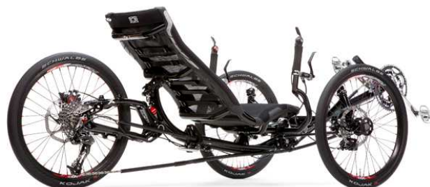
Neues ICE Sprint X, ink black mit rot eloxierten Applikationen

Schalensitz, 26" Hinterbau oder hydraulische Scheibenbremsen sind auch für das Sprint X erhältlich (empf. ab VK 3290,00 Euro). Farbe: ink black