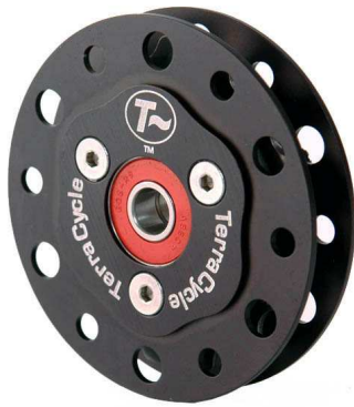
15 Zähne Elite Kettenleitrolle mit Aluminium- oder Titanritzel erhältlich

Und auch der Carbonsitz kann optional für das ICE Adventure und das ICE Sprint geordert werden.