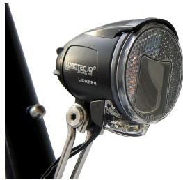
Lumotec IQ Cyo T

Mit den neuen Scheinwerfern Lumotec Lyt für die Lichtanlage mit Seitenläufer Dymotec 6 (169,00 Euro) und Lumotec IQ Cyo mit Tagfahrlicht für die Lichtanlage mit SON Nabendynamo (469,00 Euro) tragen wir den aktuellen Entwicklungen auf dem Scheinwerfersektor Rechnung.