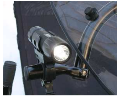
Windwrap GX mit optionaler Scheinwerferbefestigung

Die einfache One Point Mount Befestigung ist für Liegeräder geeignet (449,00 Euro). Für Dreiräder ist eine Ausführung der Befestigung mit Klappmechanismus zum einfachen Auf- und Absteigen erhältlich (549,00 Euro).