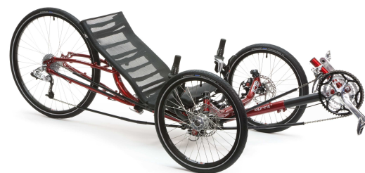
ICE Sprint mit 26" Hinterbau

Der bereits bekannte 20" Hinterbau ungefedert, wird ab sofort durch eine 26" Variante bereichert. Damit können sich auch potentielle ICE Vortex Interessenten ihr individuelles Wunschrad aus unserem kompletten Baukasten zusammenstellen. Beide ungefederten Ausstattungsvarianten bieten wir zum gleichen Preis an (2490,00 Euro).