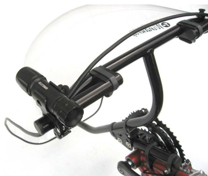
Windwrap XT mit optionaler Scheinwerferbefestigung