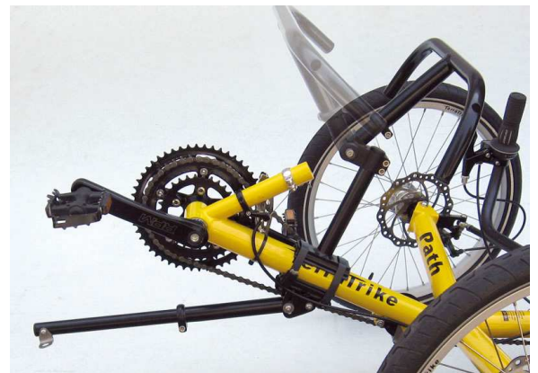
Windwrap GX mit Swing Option zum einfachen Ein- und Ausstieg bei Dreirädern