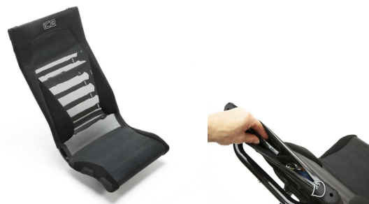
Neuer ICE Netzsitz

Im Laufe der Fahrradsaison 2011 bekommt der Netzsitz einen neuen formschön gestalteten Sitzbezug der nach unten geschlossen und am oberen Ende mit einer wasserdichten Aufbewahrungstasche versehen ist.