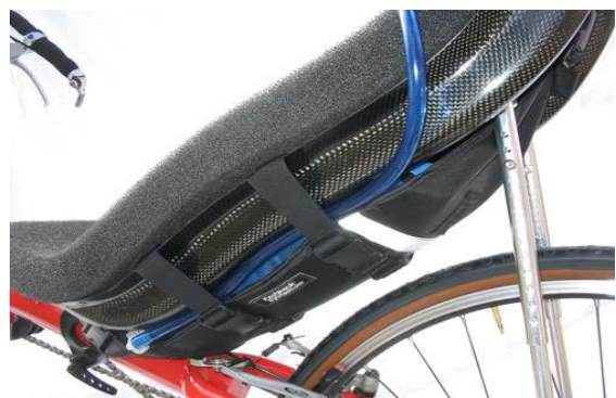
FastBack Trinksystem von TerraCycle für Liege- und Dreiräder erhältlich für 2 oder 3 Liter Fassungsvermögen