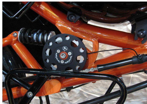
Kettenleitrolle TerraCycle mit \varnothing 101 mm und 23 Zähnen an Street Machine Gte