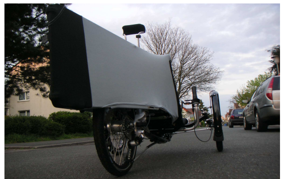
aerodynamische Heckverkleidung von TerraCycle an Trice