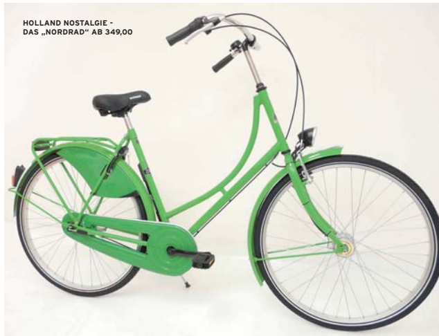
HOLLAND NOSTALGIE - DAS „NORDRAD“ AB 349,00